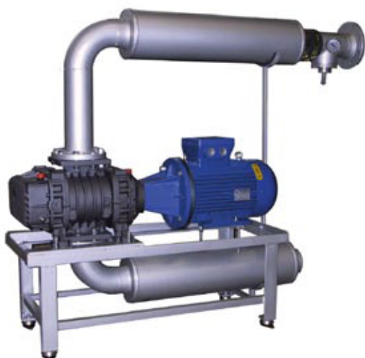
Depressore BORA 233 con trasmissione diretta