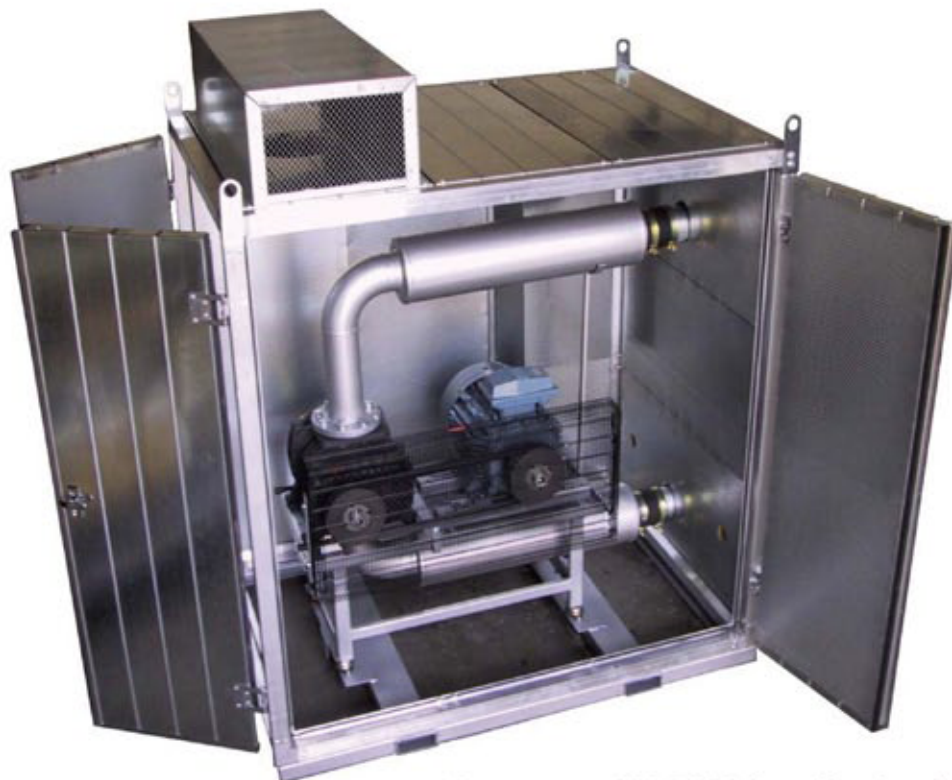
Depressore BORA 233 in cabina fonoisolante

Il progetto BORA fornisce il massimo della sua potenzialità nella versione aspirante.