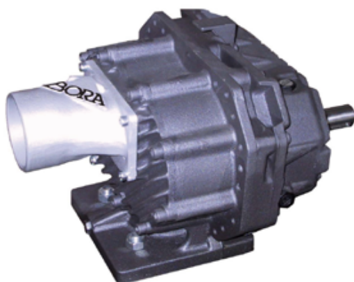
BORA 103 ad asse nudo

I rotori corti e di grande diametro sviluppano velocità periferiche più elevate per minimizzare il riflusso del gas trasferito.