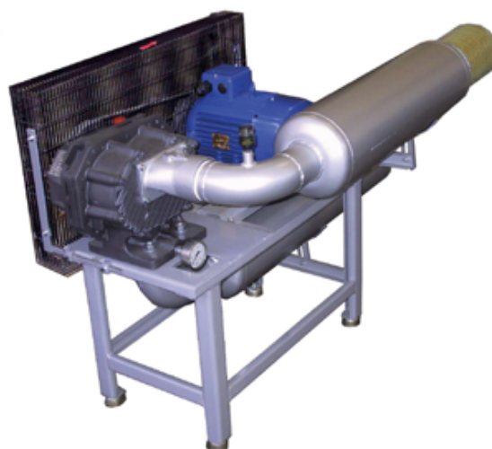
Compressore BORA 103